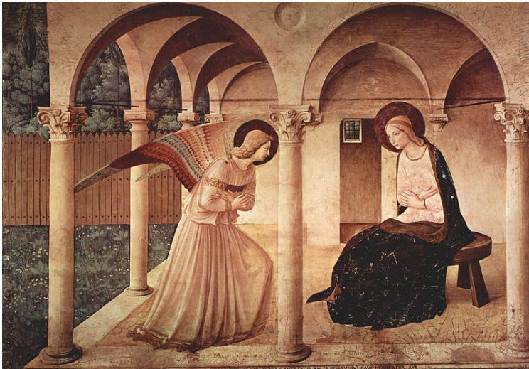
Fra Angelico Florence

We hadden het over engelen in religie en kunst. Hij kende de meest bekende engelen uit de bijbel zoals ze vroeger door schilders en beeldhouwers gevisualiseerd waren. De annunciatie ( verkondiging ) door mijn collega de engel Gabriël is zo mooi geschilderd door verschillende kunstenaars.