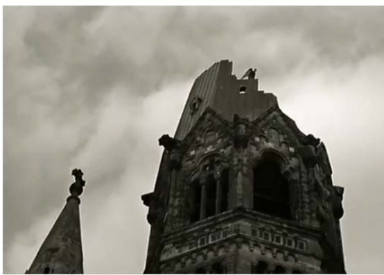
Trailer - Wings of Desire