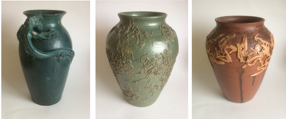
2 Vaas Willem Coenraad Brouwer. h. 27 cm 1909 (?)

Ik verkeerde in een lastige periode en merkte dat het een abstract zelfportret was geworden. Soms moet je het hoofd buigen en over jezelf heen kijken om nieuwe mogelijkheden te ontdekken.