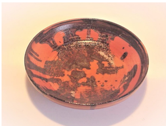
12 schaal P.v.S. 2020 h.6 diameter 24 cm

De vorm heb ik kunnen nabootsen in klei, maar het blijft een vraag waar het bokaaltje dat Rembrandt als uitgangspunt heeft gebruikt van gemaakt is.