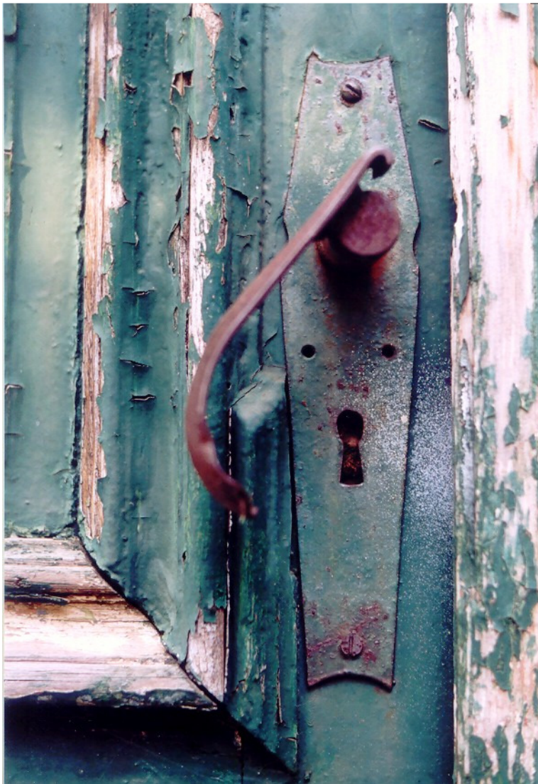
10 Deur Schwerin (DL) P.v.S foto 2005 40 x 60 .

Wat een dilemma's heeft zij meegemaakt en wat een moed heeft ze getoond.