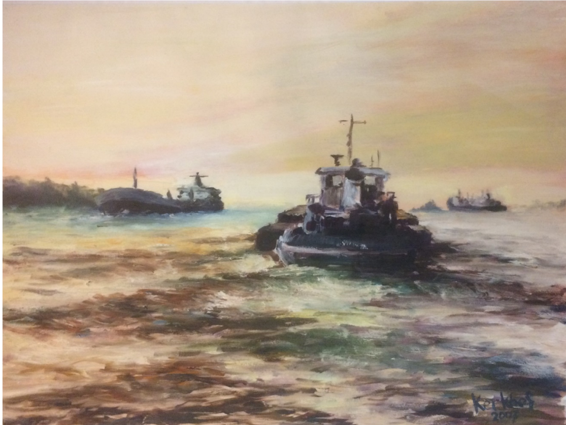
6) Jan Kerkhof "Avondnevel boven de Mississippi" 2007 olieverf op papier. 60 x 45 cm

Mijn eerste modelstudie, gemaakt in 1973, tijdens mijn avondopleiding handenarbeid en tekenen, toen ik nog als elektrotechnisch tekenaar werkte en van beroep wilde veranderen. De schoonheid van het model raakte mij zo diep dat ik haar nog steeds in het beeldje terug kan zien.