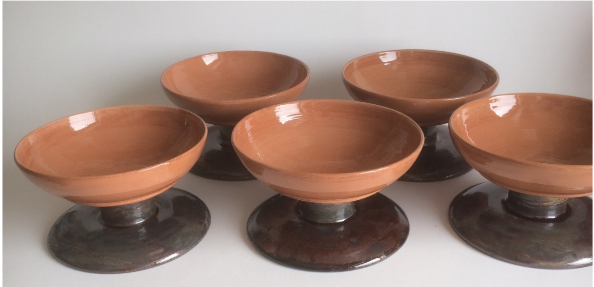
11 Rembrandtbokaaltje P.v.S. h 8 cm 2019

en heeft hij een uniform uiterlijk. Deuren symboliseren voor mij ook een verleden en een nieuw begin.