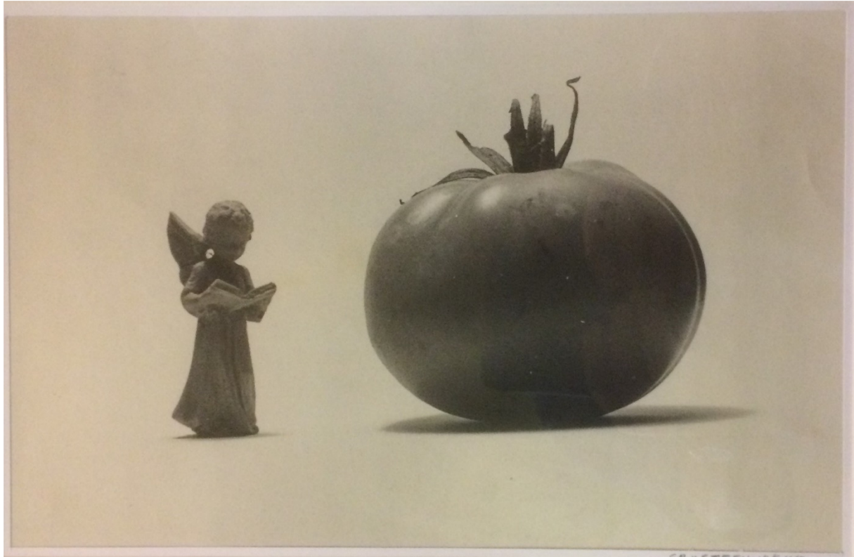
7 Zonder titel C.A. van Steenwijk. foto 1968 32x21

Mijn broer behoorde tot de groep die nog de dienstplicht moest vervullen.